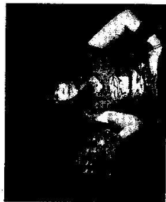
Famfárum na Dětském divadelním festivalu

V dubnu a květnu si děti z Plzně i okolí zahrály hned několikrát divadlo. Možnost měly na dubnovém Dětském divadelním festivalu, který hostila 1. ZŠ a pro divadelní soubory a veřejnost uspořádala Komunitní škola (KoŠ). Přehlídka dvanacti představení byla nesoutěžní, divadelní soubory mohly vidět vystoupení konkurence a vzájemně se inspirovat. Vedle bohatého celodenního programu například, jak jinak než divadlem, se mohli návštěvníci zúčastnit i výtvorných dílen pláckování a situisku.