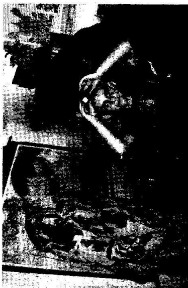
SVÍTÍ I ČERVENÉ. Možnost vyzkoušet si vojenskou čelovku, si nemohli kluci nechat ujít.