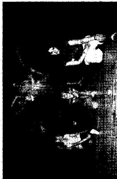
JE TO DRŽINA. Že balet není legrace a dá někdy pořádně zabrat, se pře- svěákli i kluci, kteří jsou na námahu zvyklí z fotbalových tréninků.