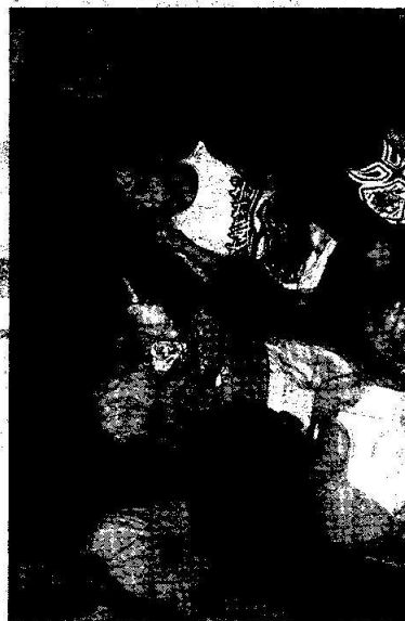
JE TO VÁŽNĚ DOBRĚ. Paměť z Aghánistánů, mandle obalené v černé podobném kulturu, dětem zachitmal.