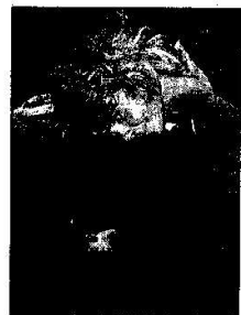
Divadelní vystoupení z roleplayingového workshopu.