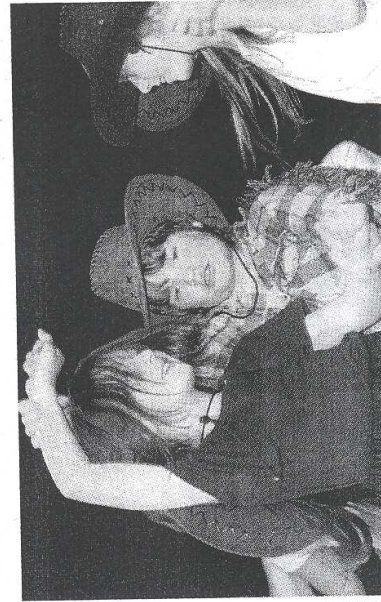
KOVBOJKA. Dětský soubor z Pernarce vystoupil na přehlídce s hrou Na Divokém západě.

Právě soubor Traple, jehož domovskou scénou je 1. ZŠ v Západní ulici, se dostal mezi postupující na národní přehlídku. Postup si zasloužil nastudováním a provedením pohádky Lakomá Barka od Jana Weřicha.