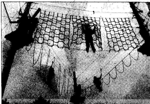
Lanové centrum Sklárna, tmelení 6. A

Třídy 6. A a 6. C také navštívily program lanového a laserového centra ve škole v přírodě Sklárna. 1. ZŠ, o. s. KoŠ