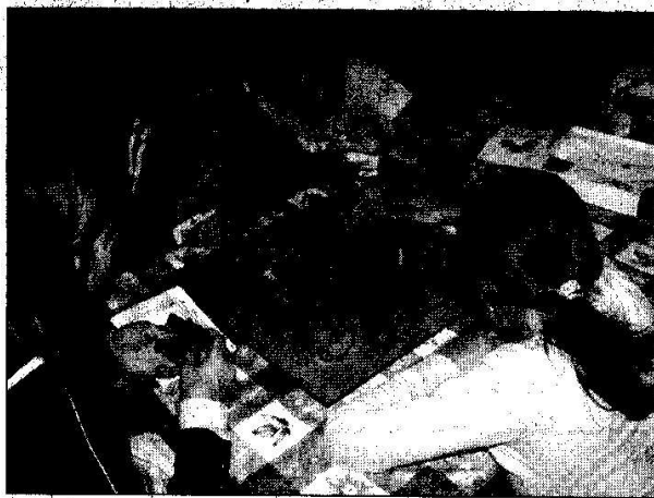
Odpoledne deskových her, tmelení 6. A

rekreačního střediska Melchiorova Huť. Tam absolvovala poměrně nabitý program zaměřený na seznámení kolektivu (vstupem na 2. stupeň se složení tříd výrazně promění; některé děti z páté třídy odcházejí na gymnázia, šesté třídy jsou složeny podle zaměření na některý předmět..., přicházejí děti z okolních vesnických škol), budování důvěry mezi žáky a jejich třídním učitelem, mapování potencionálních konfliktních situací, uvědomění si užitečnosti, schopnosti spolupracovat a v neposlední řadě jsme v programu nezapomněli na důraz na individualitu každého žáka.